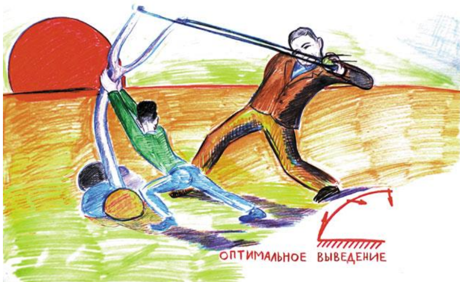
Оптимальное выведение спутника на орбиту.

расчете практически всех возможных программ управления выведением спутника.