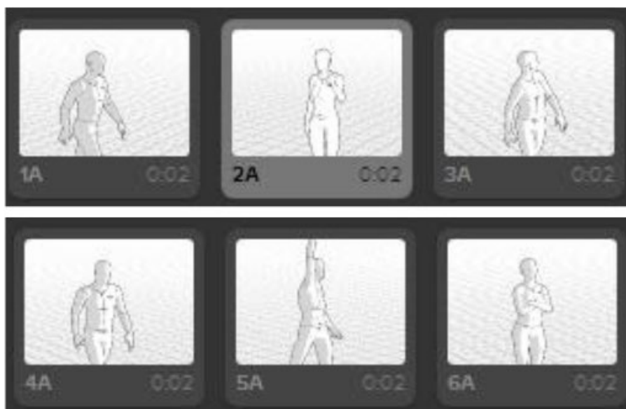
Рис. 5. Раскадровка, полученная в результате

Как видим, возможности для генерации комикса в Storyboarder позволяют использовать его лишь в случаях с подготовленным текстом. Расширение функционала и корпуса Storyboarder позволит эффективнее работать с визуализацией натурального текста, однако мы видим дальнейшую разработку в рамках собственного приложения.