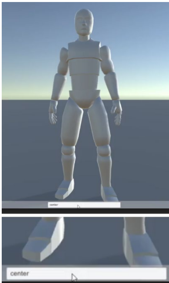
Рис. 4. Извлечение информации о кадре из текста

Другая работа [22] связана с решением задачи извлечения информации о постановке кадра из текста. Для этого создана система анализа текста и вычисления необходимых настроек камеры из контекста. Работа находится на раннем этапе: воссоздается функционал текстового распознавания кадра, аналогичный Storyboarder (см. рис. 4).