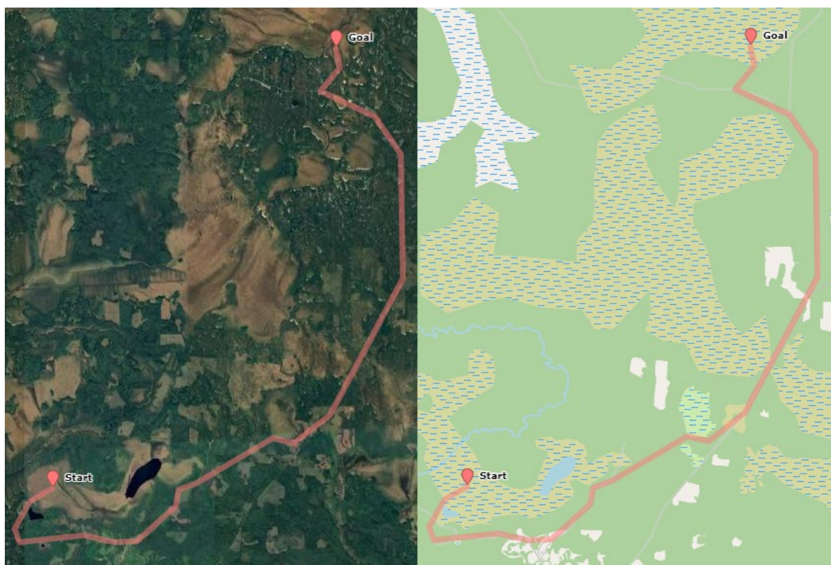
Рис. 3. Пример использования программной системы для построения маршрута на пересеченной местности. Слева - спутниковый снимок, справа - данные OpenStreetMap, которые использовала система.

Описанные подходы к построению маршрутов на пересеченной местности были реализованы в программной системе на языке Python. В качестве географических данных использовались открытые данные OpenStreetMap ( www.openstreetmap.org ). Программный интерфейс позволяет скачивать, обрабатывать и сохранять географические данные, строить граф видимости, производить построение маршрутов на пересеченной местности, экспортировать и визуализировать результаты. Пример использования системы для навигации по территории Подмосковья представлен на рис. 3. На изображении видно, что маршрут был проложен в обход таких труднопроходимых местностей, как болота и топи (представлены штриховкой). Изначально маршрут идет в противоположном направлении от цели (Goal), так как таким образом возможно быстрее всего пересечь топь и выйти на дорогу.