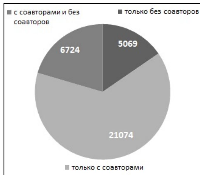
Рис. 1. Три подмножества авторов

Результаты анализа показывают, что множество из 33 тысяч авторов можно разбить на три непересекающихся подмножества, что продемонстрировано на диаграмме (рис.1).