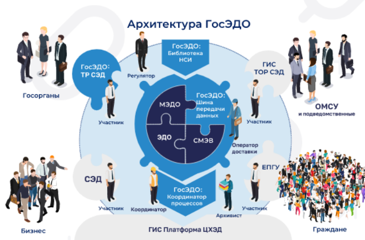
Рис. 3. Официальный сайт ГИС ГосЭДО. https://gosedo.ru/сервисы-госэдо

Государственная информационная система ГосЭДО предоставляет централизованные сервисы, реализующие стандарты единого информационного пространства при работе с электронными документами на всех стадиях жизненного цикла информационного взаимодействия.